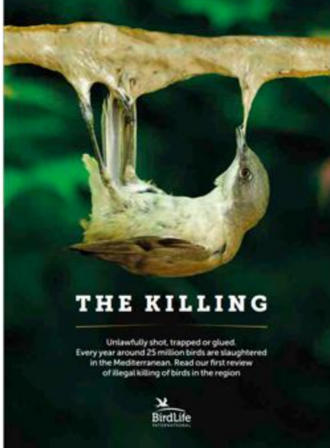
Страшный отчет BirdLife International

Ежегодно в странах Средиземноморья незаконно отлавливается около 25 миллионов диких птиц . К таким выводам пришли специалисты глобальной природоохранной ассоциации BirdLife International.