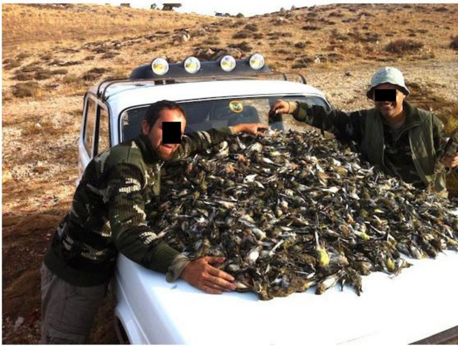
Птицы летели тысячи километров не для этого!

Каждый год, осенью и весной, около 50 миллиардов птиц по всему миру отправляются в длинное путешествие от мест гнездования к местам зимовки и обратно. Для них это очень утомительная и опасная дорога, иногда в десятки тысяч километров. Мигрирующие птицы должны выдержать недостаток еды, атаки хищников, тяжелые погодные условия, пересечь моря, горные системы и безводные пустыни, порой найти замену пропавшим местообитаниям. Люди также устраивают специальные и случайные преграды, что дополнительно усложняет путешествие птиц.