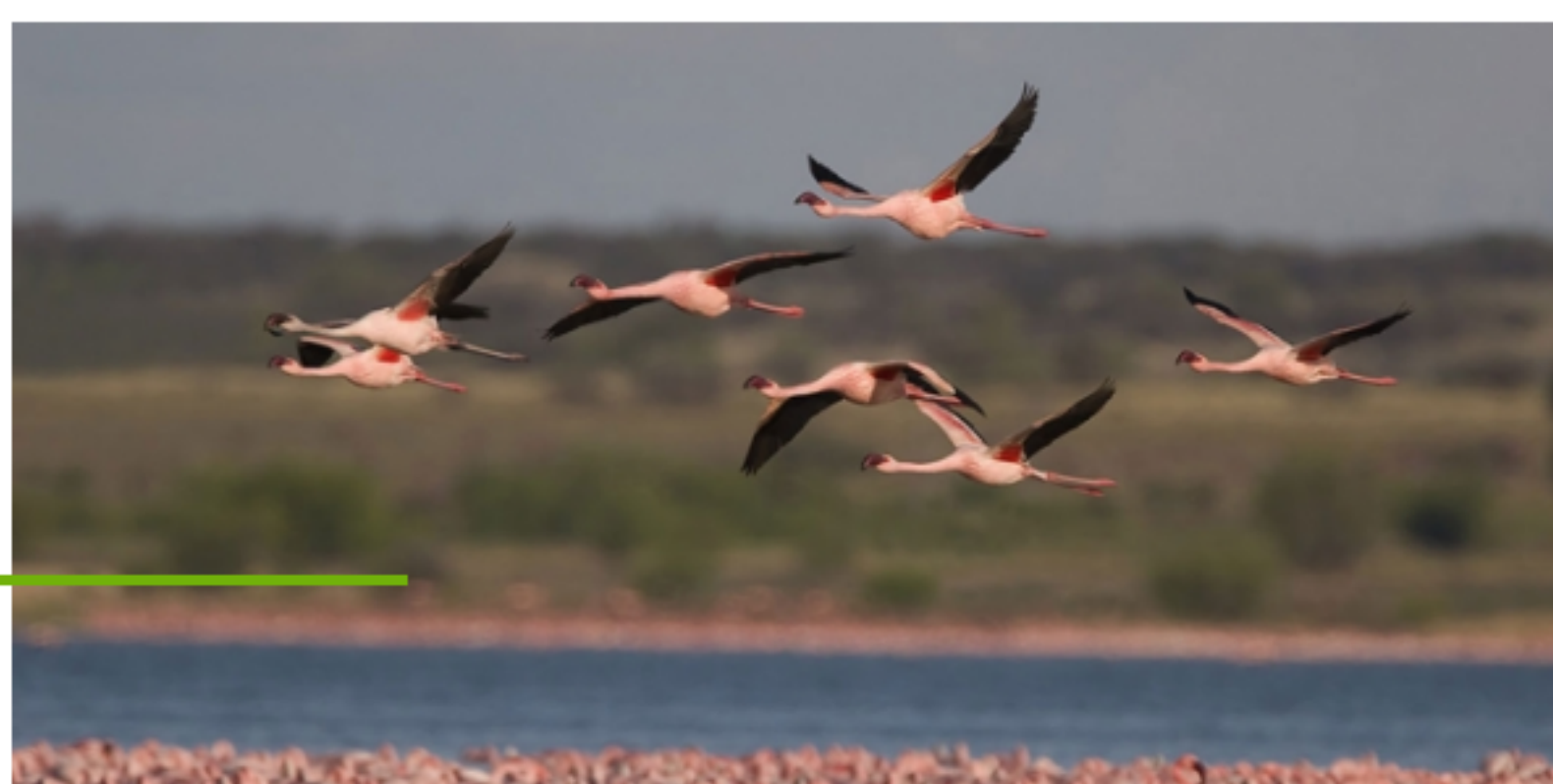
Las aves migratorias son amenazadas por la caza, la captura y el comercio ilegal.

Por UN.ORG - 10 Mayo, 2016 - En Ambiente 0