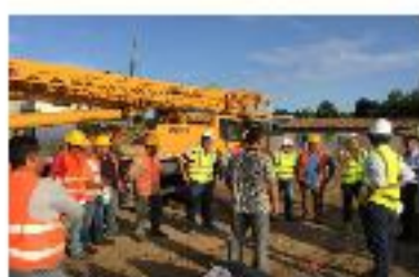
Les entreprises chinoises au secours