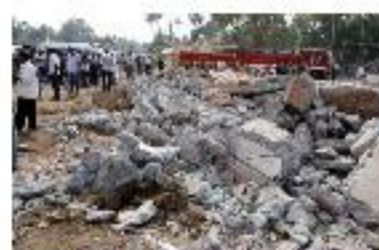
Incendie en Inde : le bilan s'élève à 112 morts, 5