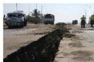
Equateur: le bilan du séisme grimpe à 525