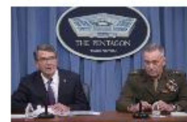
Un chef de l'EI tué dans un raid américain :