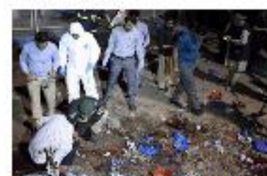
Pakistan : un attentat suicide à Lahore fait 69