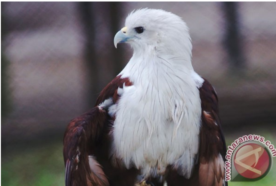
Ilustrasi - Elang bondol

Gorontalo (ANTARA News) - Gorontalo Biodiversity Forum (GBF) memberikan edukasi tentang pelestarian burung di Danau Limboto, kepada siswa SD Negeri 3 Telaga Jaya, Kabupaten/Provinsi Gorontalo, Selasa.